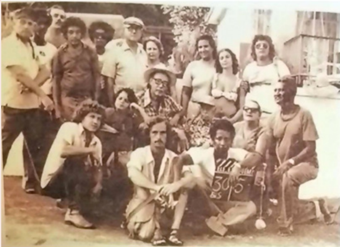
EQUIPE FILME LULU DE BARROS ELE ELA QUEM??